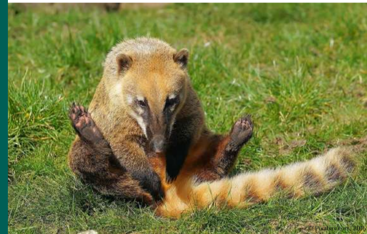
Coati roux Nasua nasua en captivité

REE 13-07-2016 : préoccupation européenne AM 10-08-2004 : détention réglementée Aucune autre réglementation nationale spécifique à l'espèce.