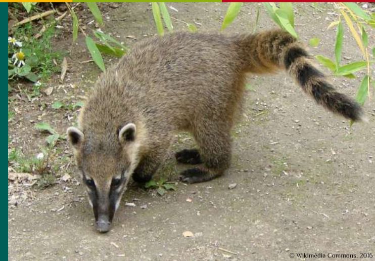
Coati roux Nasua nasua , originaire d'Amérique centrale et du Sud